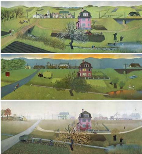
1953 bis 1972 (es fehlt hier das Bild vom Januar 1963)

Die Bilder werden aktuell als Animation auch dazu genutzt, um die Stadtentwicklung in Köln zu thematisieren, siehe http://www.nabis.de/stadtentwicklung.html .